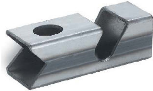
Maschinenbau Ständerelement 3,0 mm Stahl (Wandstärke)